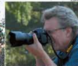
Текст и фото: Том Чемберз www.tomchambersphoto.com